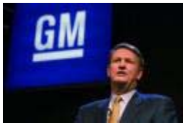
Président Rick Wagoner de GM