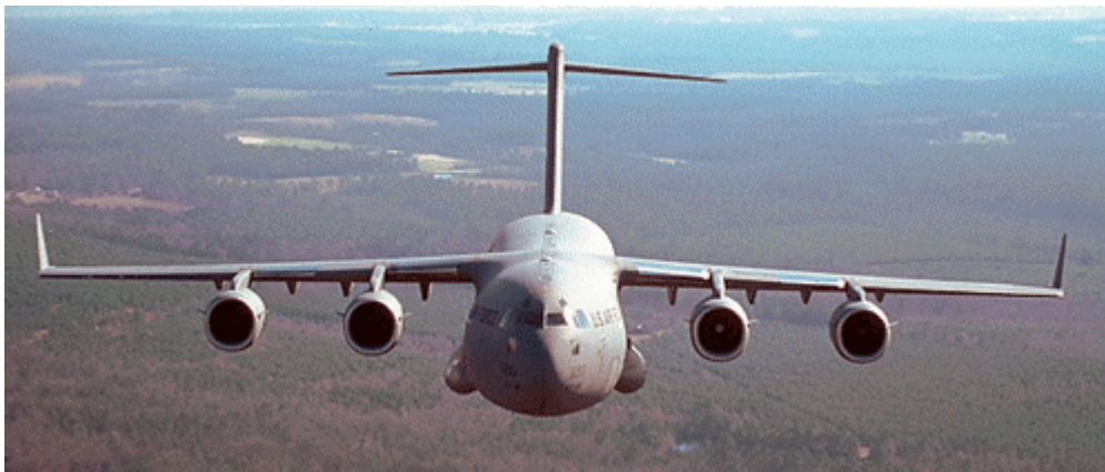
Boeing C-17 Globemaster III, Le plus versatile Airlifter du monde Image: Boeing