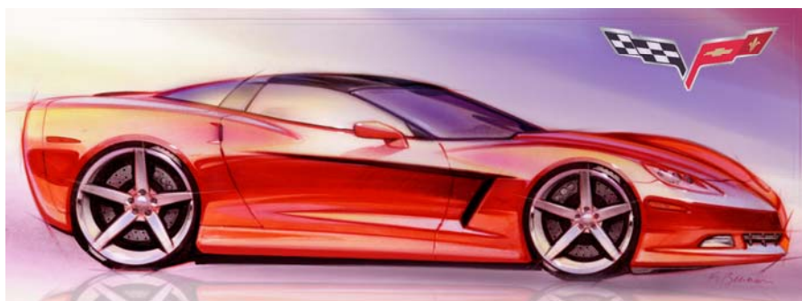
Corvette C6 Dessin de concept