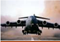
Boeing C17 Globemaster III